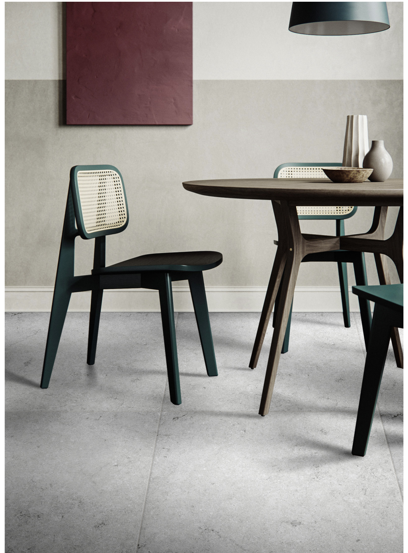
CS120120B BLANC | 120X120 | 48"X48"