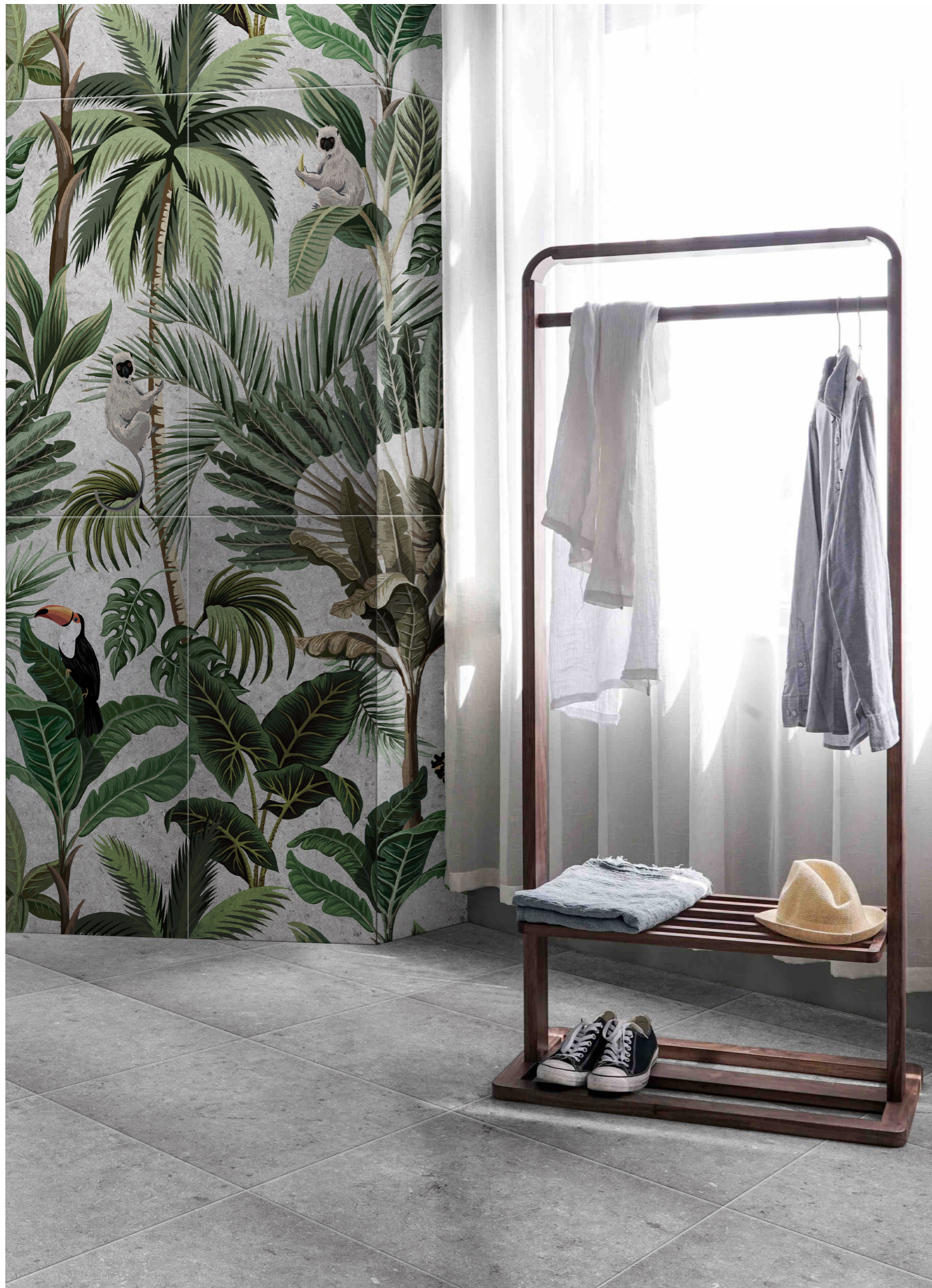
CS6060G GRIS | 60X60 | 24"X24" | CS60120SG SAFARI GRIS | 60X120 | 24"X48"